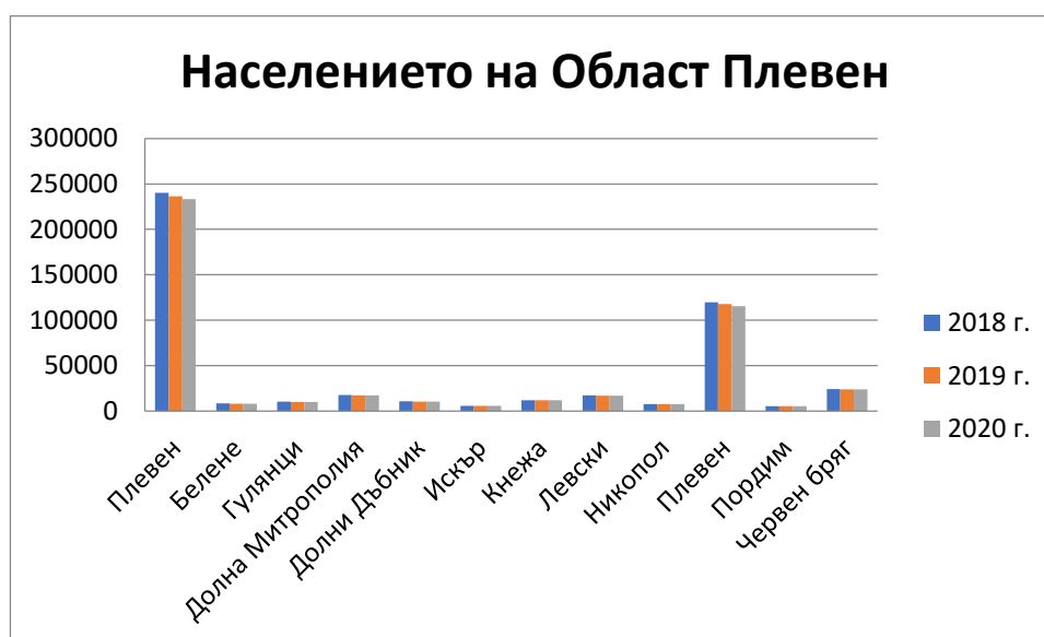
Фигура 3 Населението на Област Плевен за периода от 2018 г. до 2020 г.