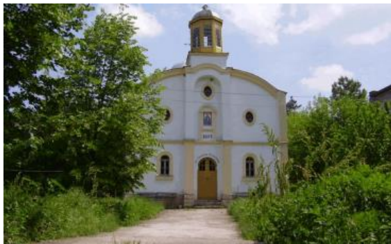
Църква „Св. Симеон Стълпник“, с. Ореховица, открита и осветена през 1896г., Паметник на културата