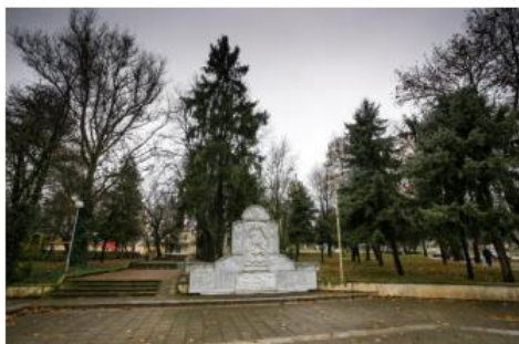
Братска могила, гр. Долна Митрополия