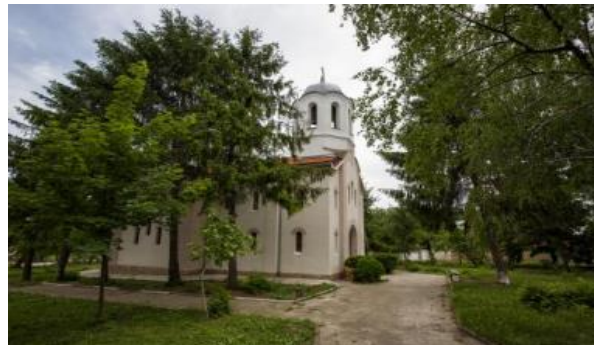
Храм „Св. Архангел Михаил“, с. Брегаре, построен между 1912 и 1915г.