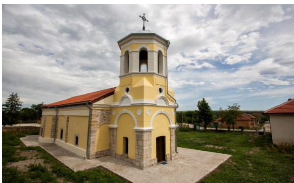
Църква „Св. Параскева“, с. Ставерци, построена през от 1868 г Паметник на културата