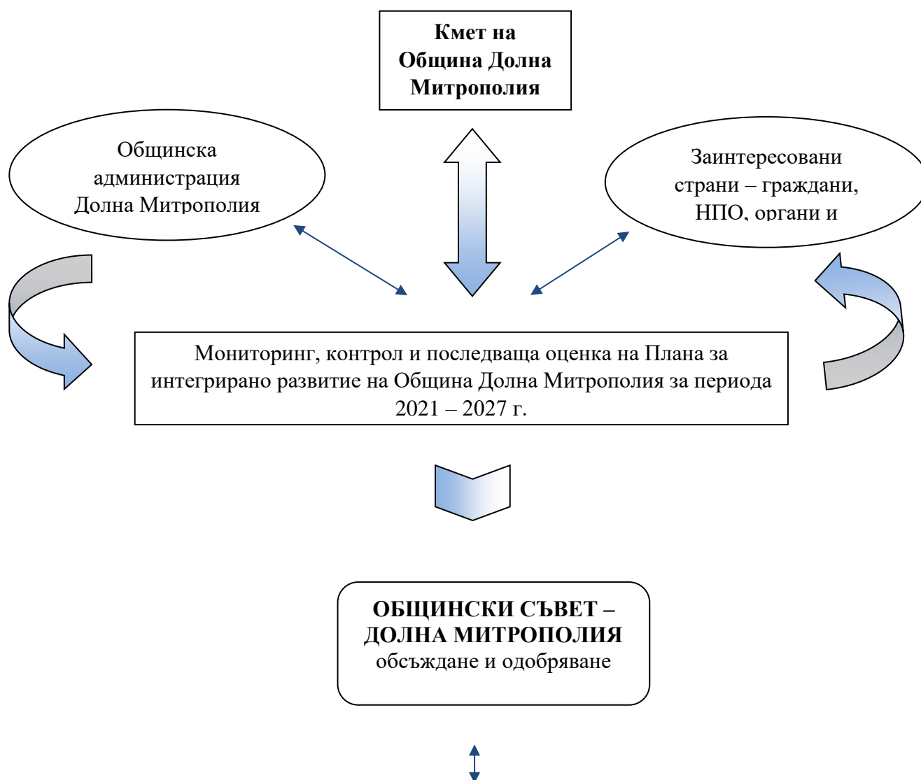
Фигура 2. Система от свързаност на участниците в изготвянето и утвърждаването на Годишният доклад за наблюдение на изпълнението на ПИРО