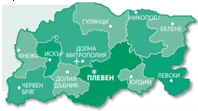
Карта 1. Местоположение