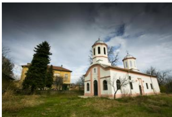
Църква „Св. Троица“, с. Горна Митрополия, построена през 1869 г.; Паметник на културата