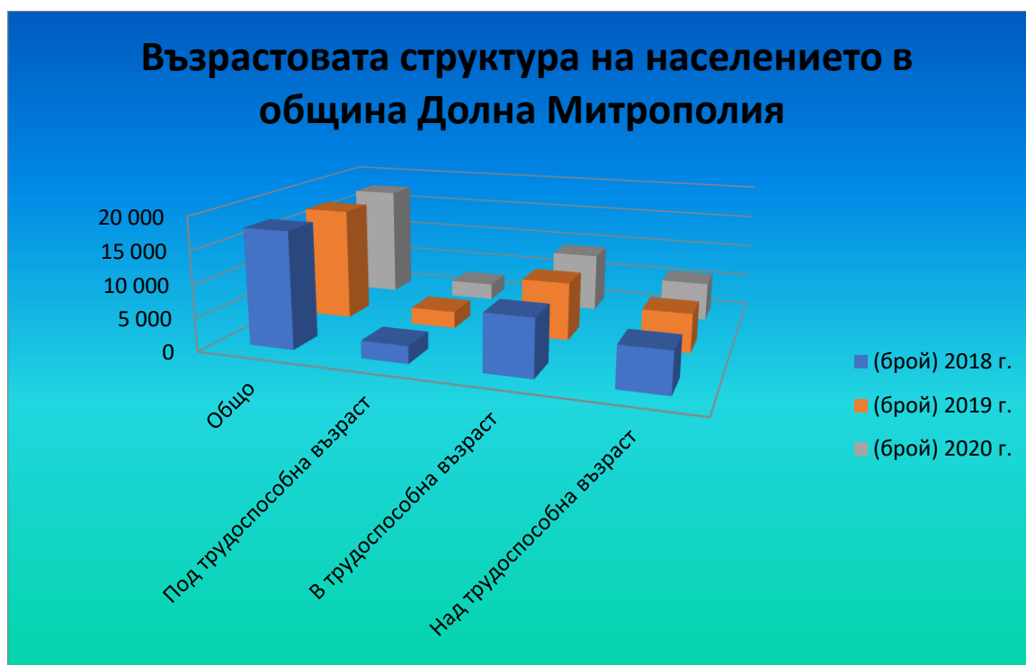
Фигура 6 Възрастова структура на населението в община Долна Митрополия