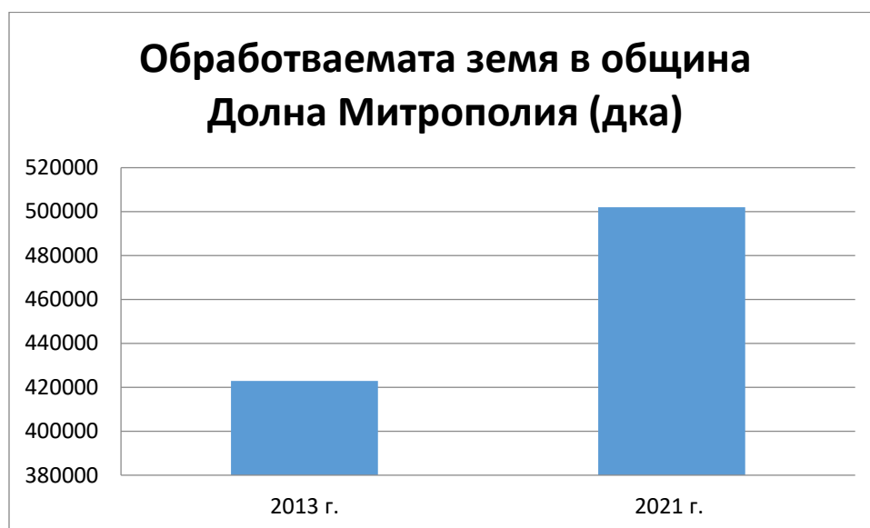
Фигура 7 Обработваемата земя в землището на Община Долна Митрополия